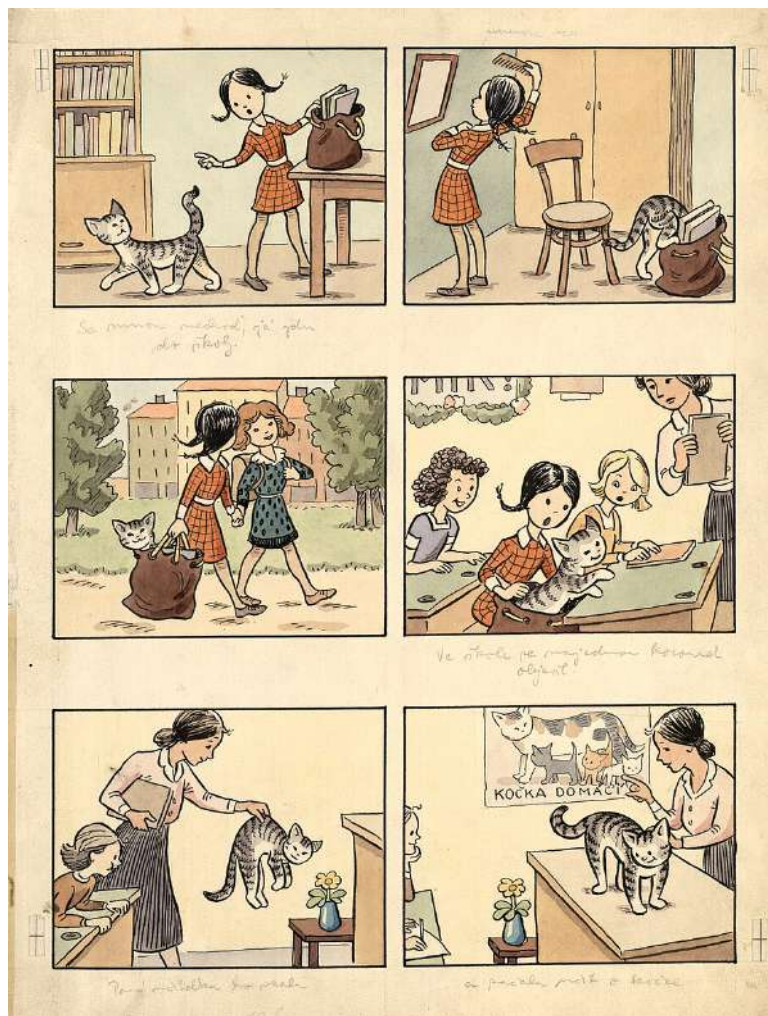
Ondřej Sekora – O Aničce, o Mourkovi, obrázky a také slovy.

Když se řekne český komiks, asi každému se vybaví legendární Čtyřlístek nebo Rychlé Šípy. Jeho historie i současnost jsou však mnohem bohatší. Především během dvacátých a třicátých let minulého století zažíval český komiks neskutečný boom, na který se ale dnes téměř zapomnělo. Na tyto polozapomenuté poklady můžete narazit na výstavě Český komiks a jeho svět, kterou od června pořádá Moravské zemské muzeum.