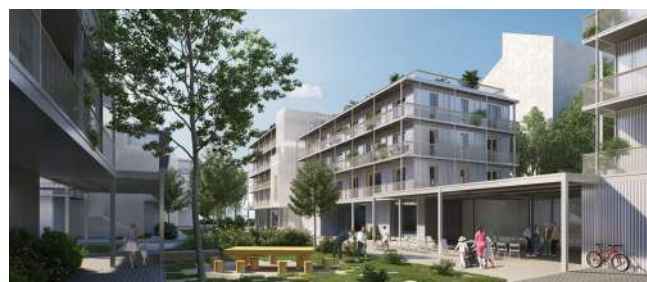
vizualizace: Chybik&Kristof Associated Architects, s.r.o.

6. 9. – 14. 10. Dostupné bydlení v Brně: Otázkou dostupnosti bydlení se dnes musí vážně zabývat každé město či obec. Prostřednictvím 25 projektů vám představíme ucelený obraz toho, jak se daří s tak nesnadným úkolem vypořádat městu Brnu.