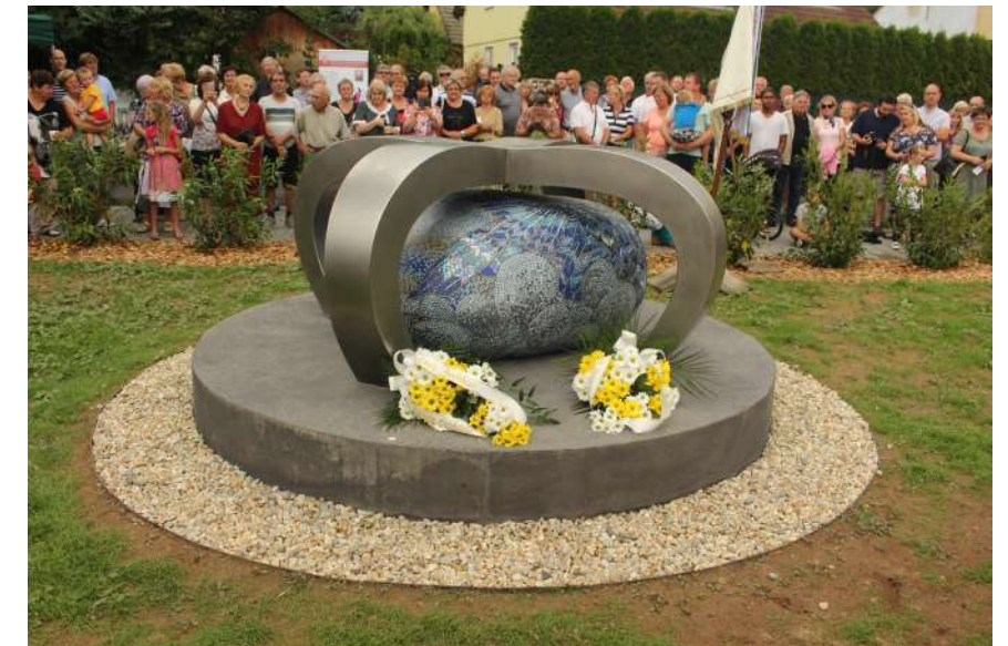
Památník pro kardinála Špidlíka, který iniciovala senátorka Jaromíra Vítková.